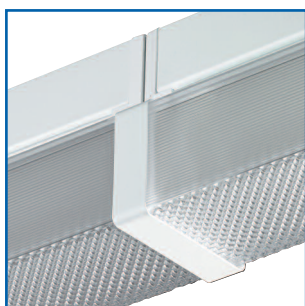
Соединитель при установке светильников в линию